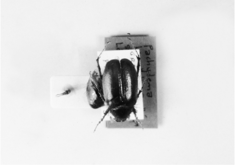
1.- Habitus de un ejemplar (macho) de la serie tipo de Pachydema ameliae López-Colón, 1986. Se trata de uno de los paratypus de Valleseco (Gran Canaria).