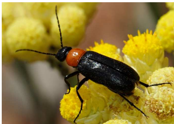
Fig. 1: Zonitis fernancastroii . Parque Natural de Sant Llorenç del Munt, Mura, 3-VI-2010, (SESMA, 2010). http://www.biodiversidadvirtual.org/insectarium/Zonitis-fernancastroii-img137308.html

KEY WORDS: Coleoptera, Meloidae, Zonitis fernancastroii , Catalonia.