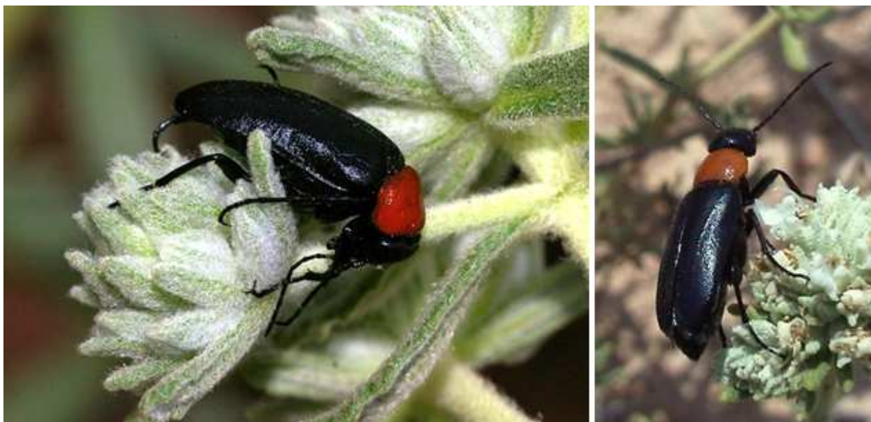
Fig. 6: Zonitis fernancastroii . Málaga, 14-IV-2010, (RAMÍREZ, 2010).

http://www.biodiversidadvirtual.org/insectarium/Zonitis-Z-fernancastroii-Pardo-Alcaide-1950-img120759.html