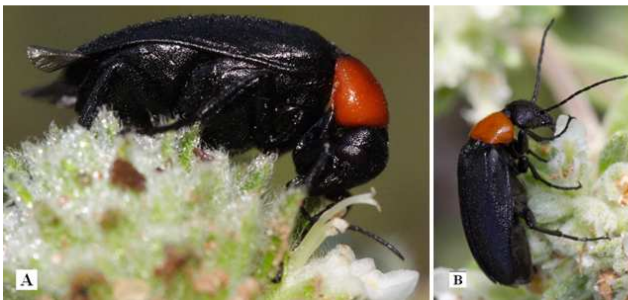
Fig. 2: Zonitis fernancastroï . Parque Natural de Sant Llorenç del Munt, Mura, foto A: 16-VI-2009, foto B: 3-VI-2010, (SESMA, 2009, 2010).

Entre las especies raras e interesantes tenemos la que da lugar a este artículo: Zonitis fernancastroï Pardo Alcaide, 1950, con muy pocas citas ibéricas y tan solo dos catalanas, ambas muy antiguas. Además de las citas comentadas del Parc de Sant Llorenç del Munt, ampliaremos con este artículo el área de distribución de esta especie con dos nuevas citas recogidas en la sección de invertebrados de Biodiversidad Virtual. Ambas aportan nuevos datos sobre la presencia de Z. fernancastroï , tanto en la provincia de Málaga como en la provincia de Valencia.