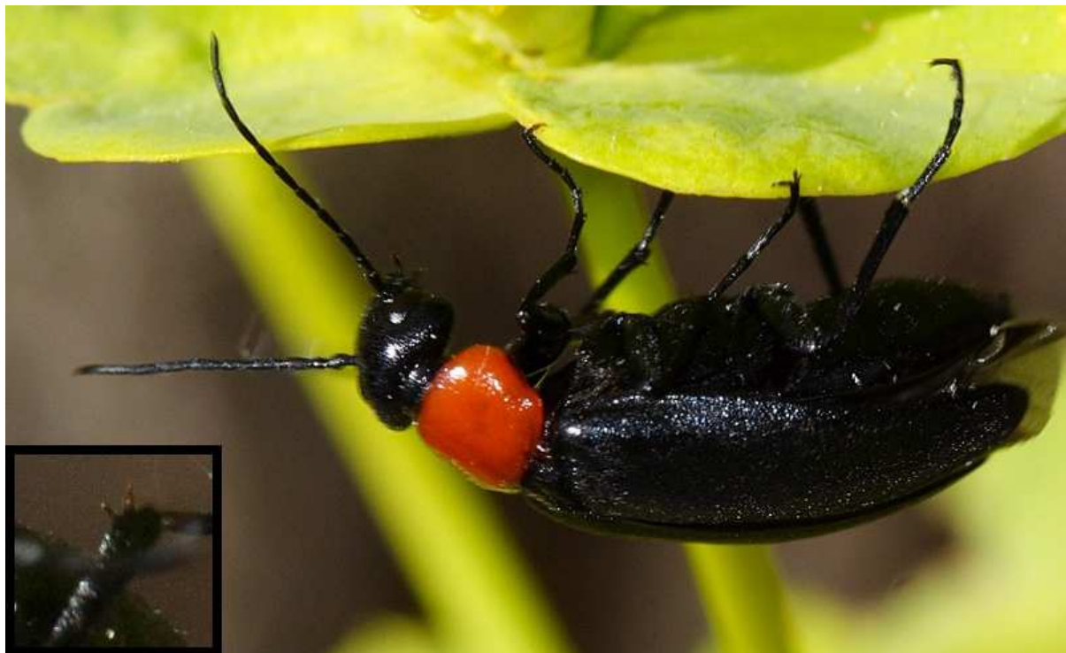
Fig. 5: Zonitis fernancastroi . A la izquierda, detalle de las espinas metatibiales traseras. Parque Natural de Sant Llorenç del Munt, Mura, 25-V-2012, (SESMA, 2012). http://www.biodiversidadvirtual.org/insectarium/Zonitis-fernancastroi-img346324.html