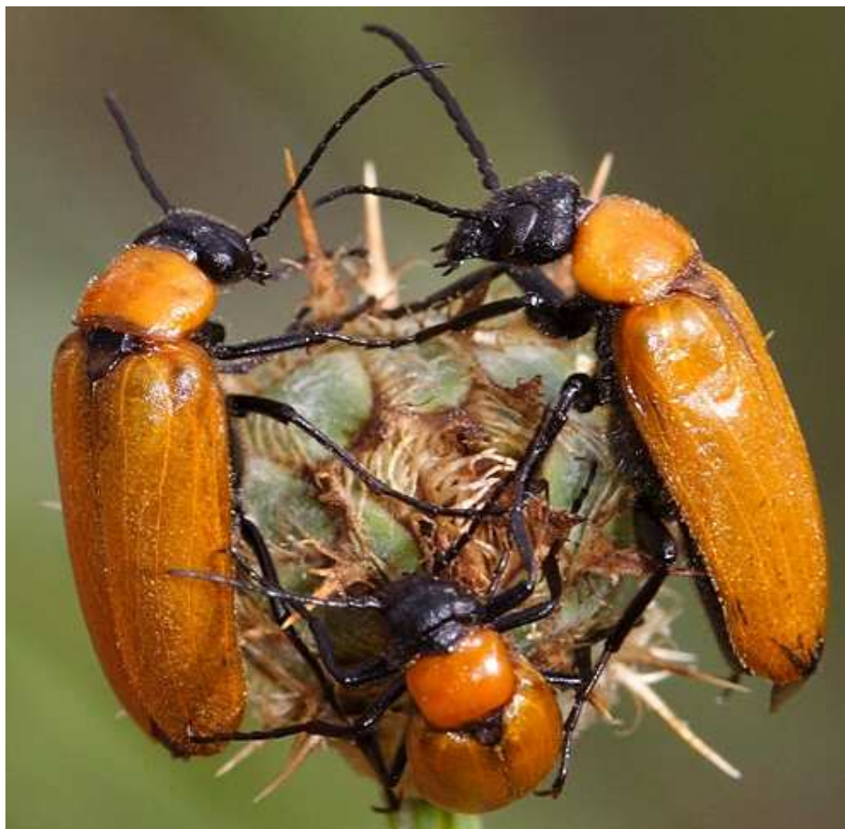
Fig. 3: Zonitis immaculata . Vacarisses, Barcelona, 25-V-2011, (SESMA, 2011).

http://www.biodiversidadvirtual.org/insectarium/Zonitis-Z-immaculata-Olivier-1789-img225805.html