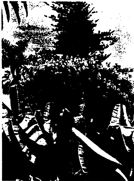
Abb.1 Vegetation in Puerto de la Cruz (Teneriffa) Vordergrund: Banane, Mittelgrund: Cassia -Pflanze.

In Wirklichkeit ist dieser Schmetterling alles andere als ein Kulturfolger wie brassicae L., auch kein Wanderer, sondern streng an seinen Lebensraum gebunden, durch Größe, Färbung, Zeichnung, Futter, Lebensweise, Flug und Genital von brassicae L. verschieden (REBEL führt ihn als gute Art an, NORDMANN vergleicht die Valvon bei beiden Arten und bildet sie 1931 sehr instruktiv nebeneinander ab).