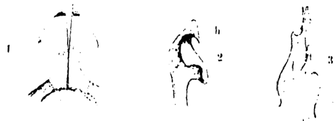
Fig. 1-3. Copulationsorgane von Julus Kraepelinorum n. sp. 1. Die beiden vorderen Klammerblätter von außen gesehen. 2. Eines derselben in \frac{2}{3} Profil; bei h ein spitzer Haken. 3. Ein hinteres Klammerblatt.

Patria: Teneriffa insula, prope oppidum Guimar.