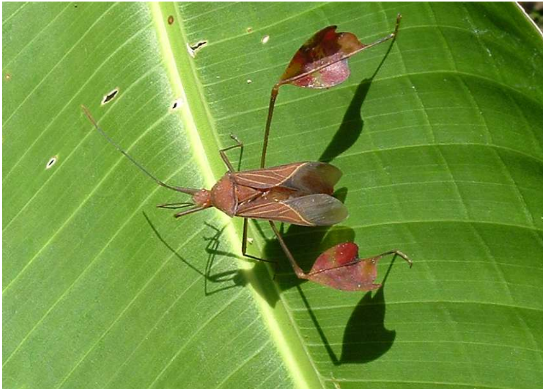
Abb. 3: Adultes Exemplar von Anisoscelis podalicus , Escazú, San José, Costa Rica, 17-XI-2006.