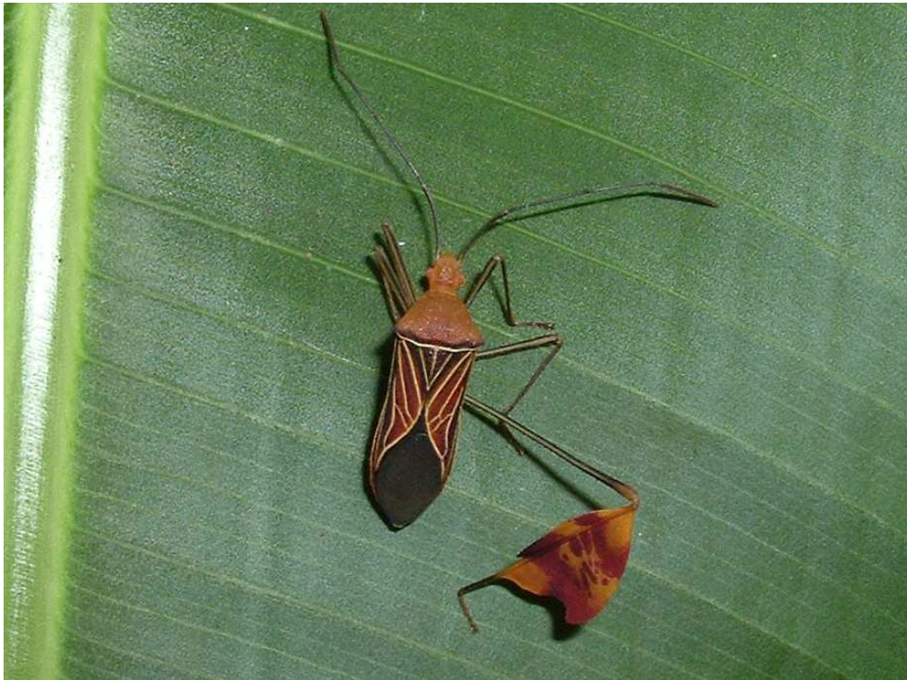
Abb. 1: Adultes Exemplar von Anisoscelis podalicus , Escazú, San José, Costa Rica, 4-XI-2006 (VAN DER HEYDEN, 2012).

http://www.biodiversidadvirtual.org/insectarium/details.php?image_id=316830