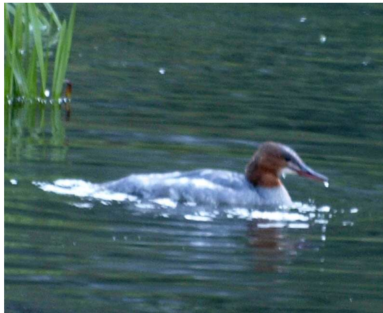
Fig. 1: Bec de serra gros Mergus merganser , Barruera, 8-VIII-2011 (CLAVELL, 2011).

La seva presència a la península és principalment hivernal i al litoral nord (DE JUANA, 2006), tot i que els darrers anys s'han produït alguns registres a l'interior. A Catalunya només se'n coneixen tres citacions homologades, encara que hi ha un important nombre de citacions que no s'han tramès als comitès de rareses (CLAVELL, 2002). El nombre de femelles duplica el de mascles (DE JUANA, 2006).